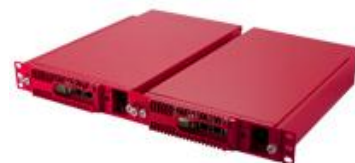
AuthWay アプライアンス版

アプライアンス提供 の「AuthWay」と ソフトウェア提供 の「AuthWay Software」の2種類がありますので、利用環境に応じあて選択することができます。アプライアンスは冗長構成（2台構成）でも1Uのラックに格納できるため、省スペース低消費電力を実現します。